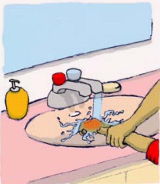
Fakalele 'a e vai mei' he tepi vai momoko 'i he funga feitu'u 'oku vela' 'o fakafuofua ki he vaha'a 'o e miniti 'e 10 ki he 20 .